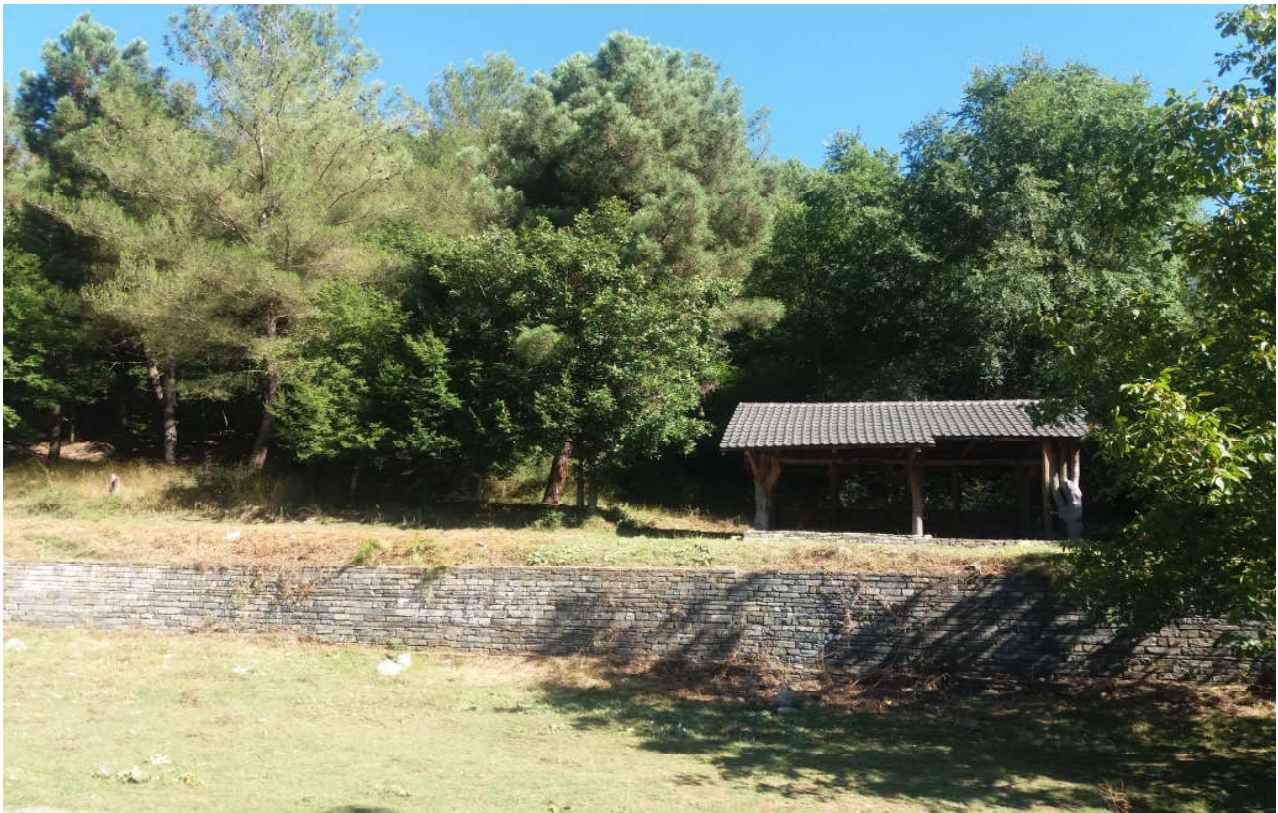
(Φωτ. 1) Άποψη του χώρου δασικής αναψυχής «ΘΥΜΑΡΙΕΣ» Ξάνθης

Η υπό μελέτη έκταση είναι δημόσια δασική έκταση και ανήκει στο Ελληνικό Δημόσιο. Αποτελεί τμήμα της συστάδας 30στ του Δ.Δ.Σ Μύκης και διαχειρίζεται από το Δασαρχείο Ξάνθης. Βρίσκεται ΝΔ της Τ.Κ Γοργόνας του Δ. Μύκης της ΠΕ Ξάνθης και απέχει 6,5χλμ από την πόλη της Ξάνθης.