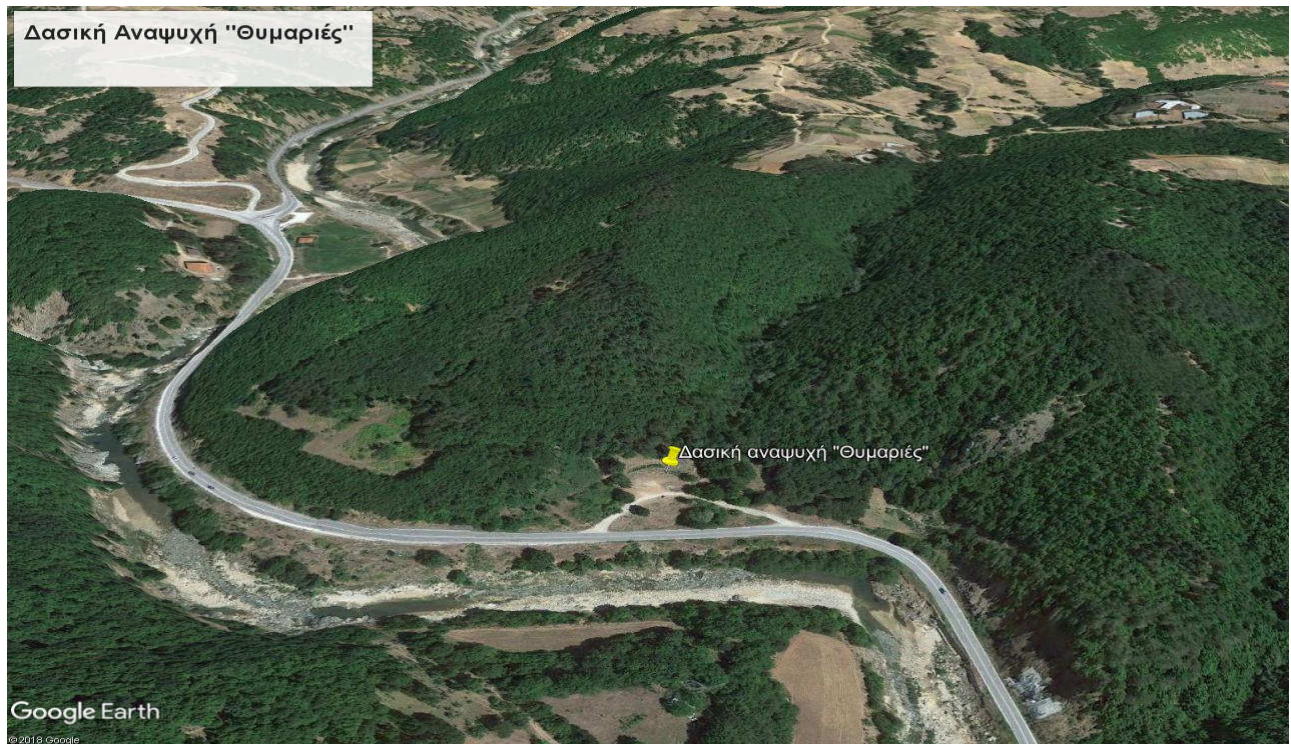
Εικόνα 2: Περιοχή επεμβάσεων