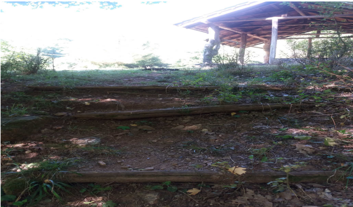
(Φωτ. 3) Υφιστάμενη κατάσταση υπάρχουσών σκαλοπατιών