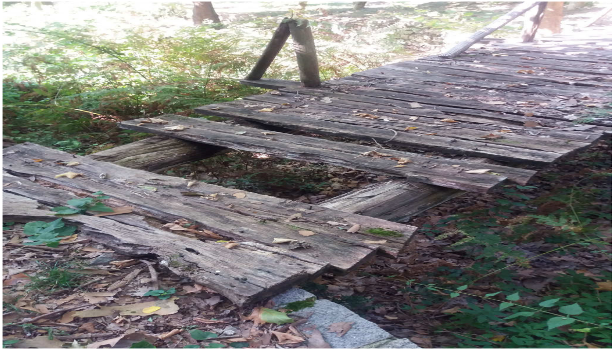
(Φωτ. 2) Υφιστάμενη κατάσταση υπάρχουσας γέφυρας

Η υφιστάμενη κατάσταση του χώρου, παρά τις κατά καιρούς ενέργειες και επεμβάσεις του Δασαρχείου Ξάνθης, στο σύνολό του παρουσιάζει σημάδια πλημμελούς συντήρησης. Οι υπάρχουσες ξύλινες κατασκευές, είναι στο σύνολό τους σχεδόν κατεστραμμένες, και ως εκ τούτου αφενός μεν προσδίδουν στο χώρο εικόνα εγκατάλειψης και αφετέρου εγκυμονούν κινδύνους για τον επισκέπτη.