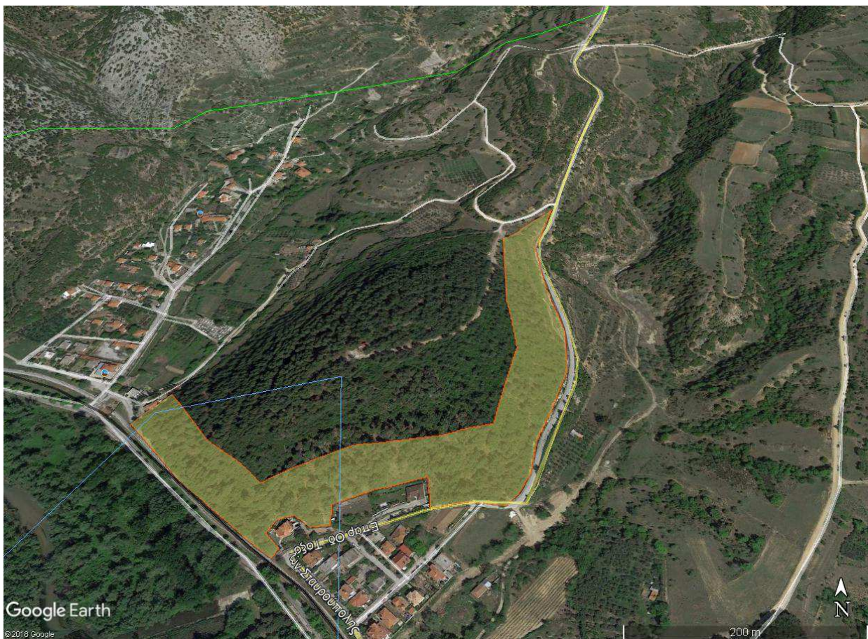
Χάρτης 2 : Περιοχή επέμβασης

Η υπό μελέτη έκταση υπολογίζεται σε 41 στρ, και εκτείνεται στη Νοτοδυτική, Νότια και Ανατολική πλευρά του αλσυλλίου και σε μία ζώνη βάθους 50 - 60 μέτρων σύμφωνα με το ανάγλυφο και την τοπογραφία της περιοχής (Χάρτης 2)